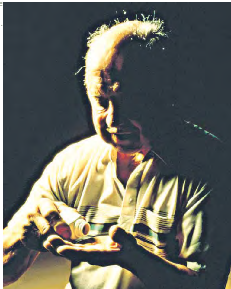
Los mayores más frágiles y los que se medican tienen mayor riesgo de deshidratación.

Es precisamente en estos casos, y cuando se encuentran ante ancianos con alguna patología de base, cuando los geriatras extreman las precauciones e insisten en la adopción de medidas preventivas, algunas "tan simples - según explica el doctor Musso- como ingerir en los meses de verano entre medio y