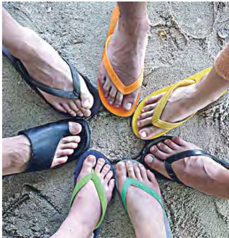
Los microorganismos responsables del 'pie de atleta' habitan en playas y piscinas.

La infección por hongos, llamada 'pie de atleta', se presenta