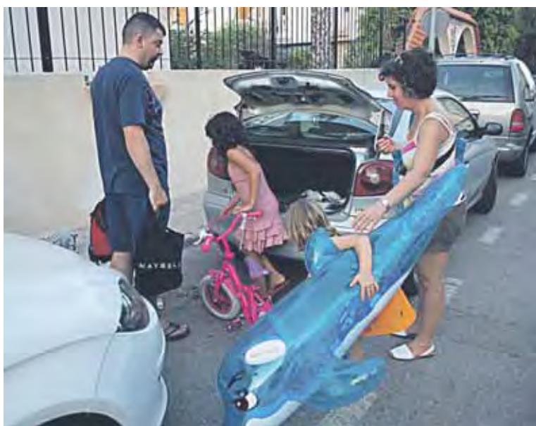
A los niños hay que tenerlos entretenidos mientras viajan en el coche.