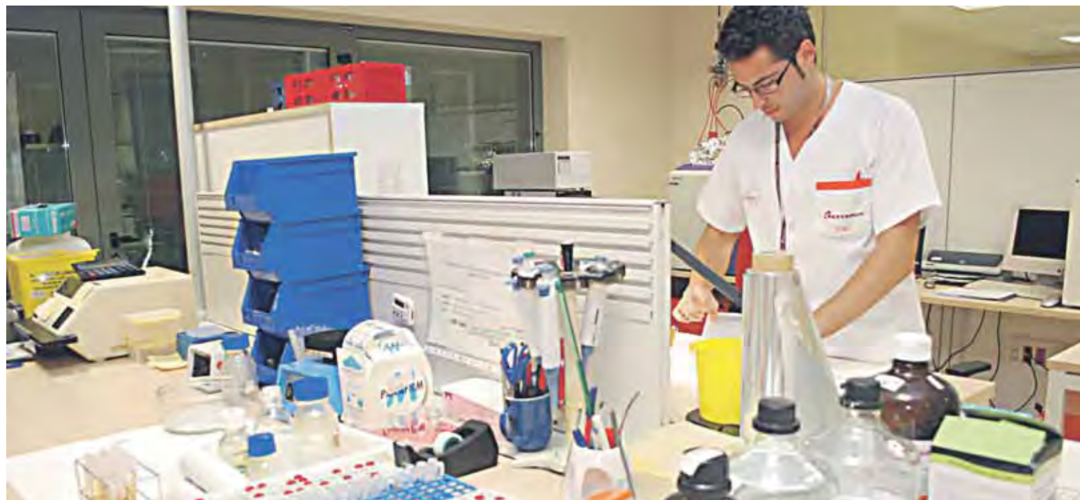
Las instalaciones renovadas y ampliadas del Centro de Bioquímica y Genética Clínica ofrecen mayor seguridad y confort para los pacientes y los profesionales.

ampliaron significativamente las posibilidades de diagnóstico hace dos años, es decir, con la implantación de la espectometría de masas en tándem (MS/MS).