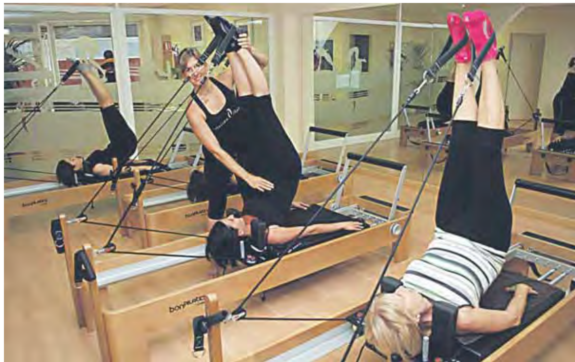
Las máquinas son reguladas por el instructor, según el tipo de ejercicio que se va a realizar (equilibrio, esfuerzo, etc.).

el caso de un ejercicio enfocado al glúteo no sólo trabaja éste sino que también "involucra la alineación de las piernas, de los brazos, la respiración... todo bajo el control del músculo transversal abdominal, que es el centro energético", explica Irene Nuñez.