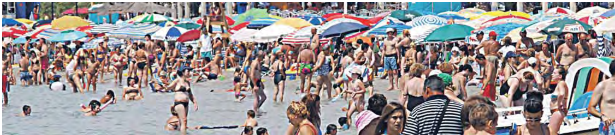
Los especialistas en dermatología recomiendan tomar el sol mientras se realiza alguna actividad en la playa o se da un paseo, evitando las típicas exposiciones acostados 'vuelta y vuelta'.