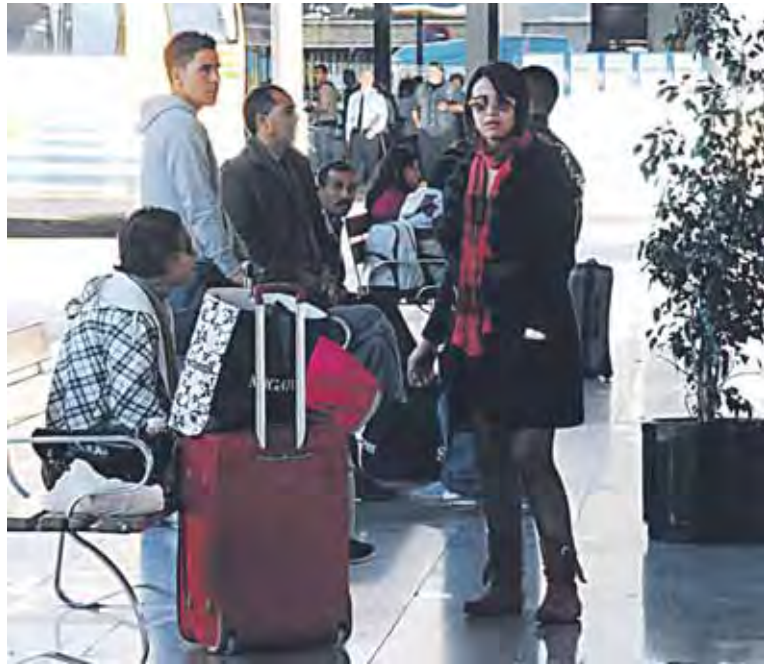
Al menos 6 de cada 10 personas que viajan a zonas de riesgo no se vacunan.

vacunación internacional es creciente desde el 2000. A pesar de ello, seis a siete ciudadanos de cada diez que viajan a zonas de riesgo no se vacunan.