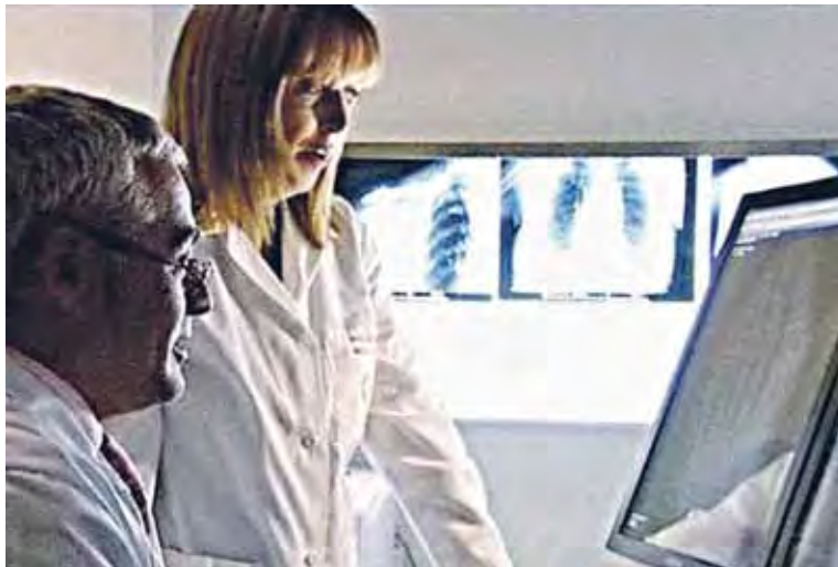
El sistema de digitalización de la imagen ofrece una serie de ventajas para el paciente.

El Centro Médico Virgen de la Caridad, de Cartagena, apuesta por la innovación