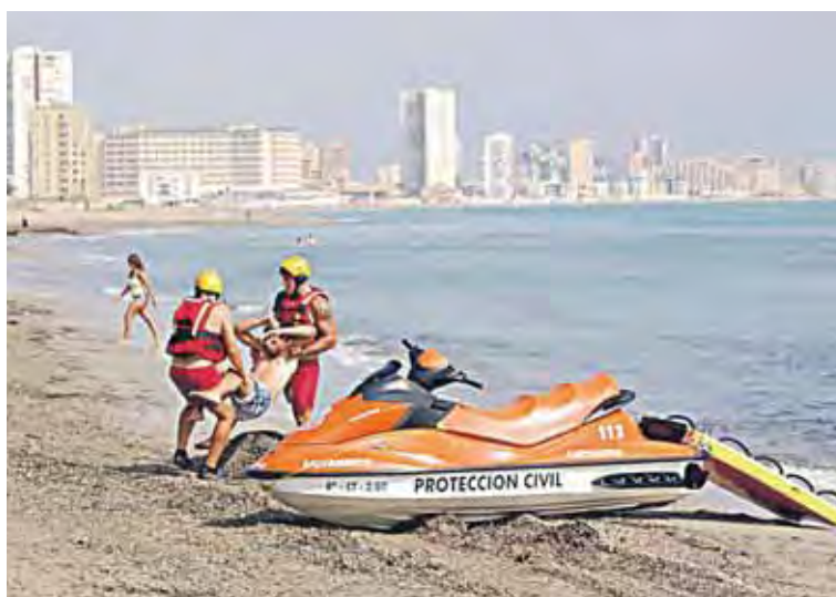
El dispositivo está habilitado entre los meses de junio a septiembre.

Durante los meses de junio a septiembre, el Plan Copla moviliza a un total de 233 personas al día, igual que el año pasado,