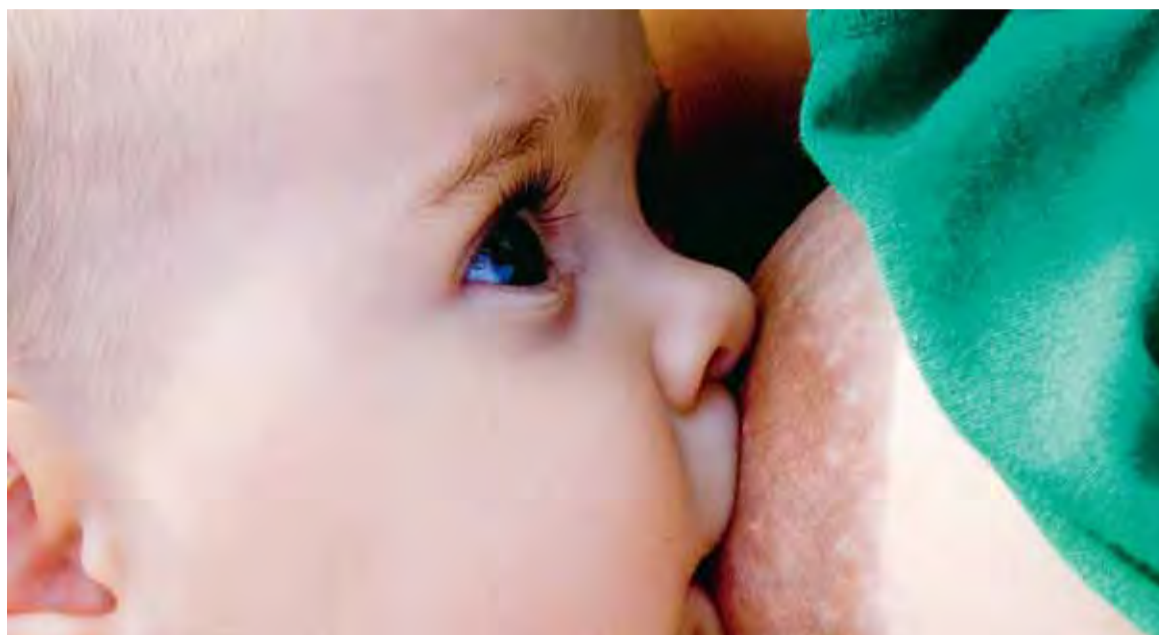
La leche materna es el alimento más seguro y ecológico que puede ofrecerse al bebé.

Esta evolución se debe, según este profesional, al compromiso institucional asumido en relación a este tema desde la Consejería de Sanidad y Consumo; junto con la fuerte implicación