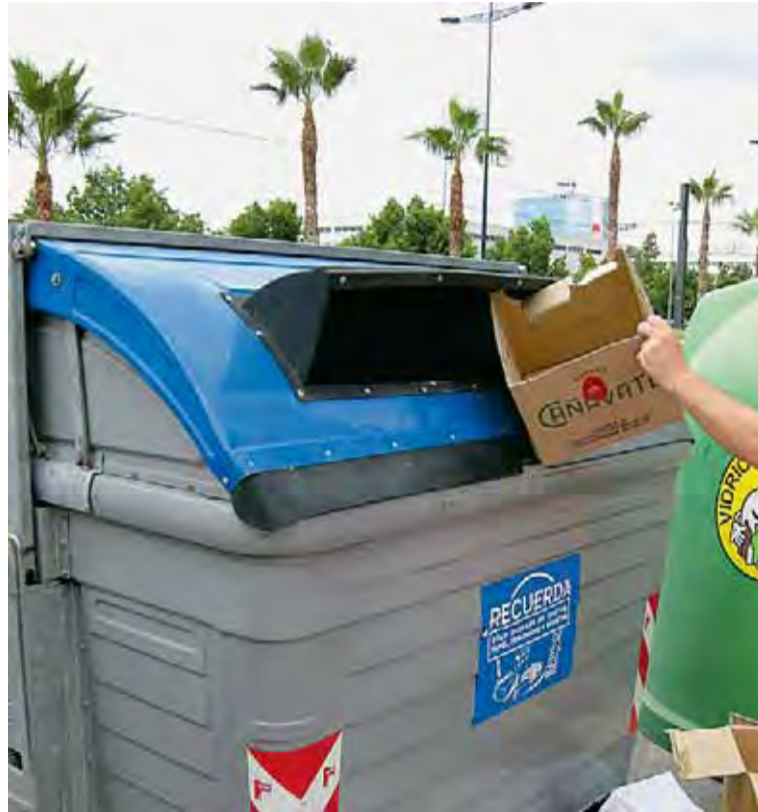
Para cada tipo de basura hay contenedores específicos.

De todos es sabido que reconverter los productos de desecho supone un importante ahorro energético y de materia prima en la manufactura de productos nuevos con materiales reciclables, además de conservarse el