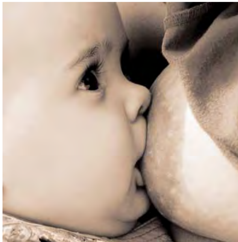
Las madres que dan el pecho tienen menor riesgo de hipertensión y osteoporosis.

Detectan nicotina en el feto del 37,5% de gestantes fumadoras estudiadas