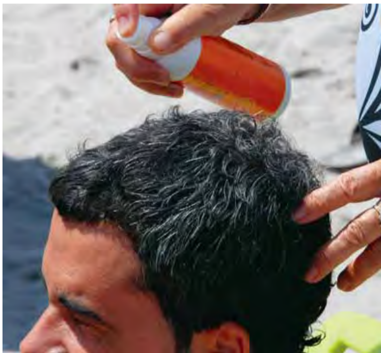
Los hombres, cada vez más interesados en lucir un cabello suave y sedoso.

Las mascarillas capilares son cada vez más demandadas también por los varones