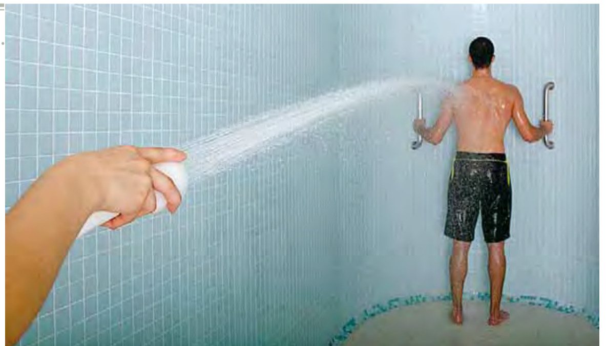
Un cliente recibe un tratamiento de hidroterapia en el centro Thalasia, situado en San Pedro del Pinatar.