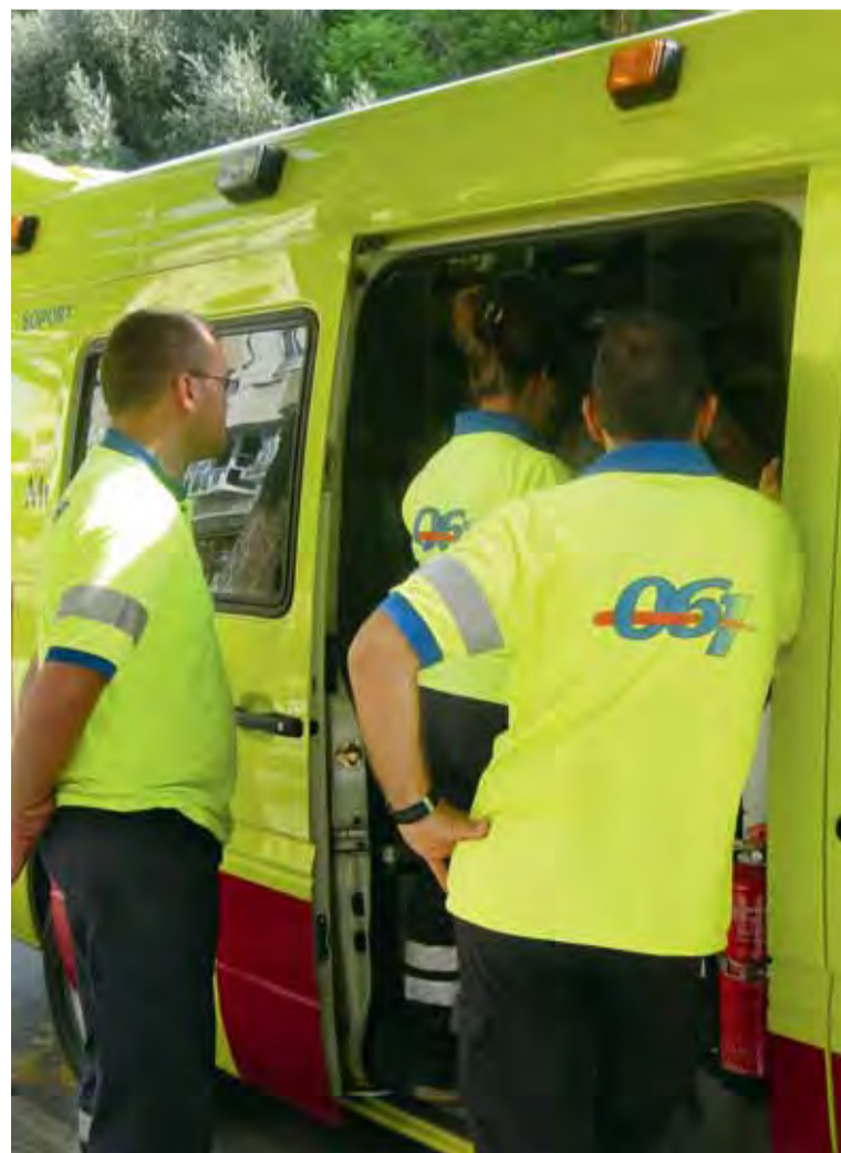
17 móviles de emergencias cubren el servicio.