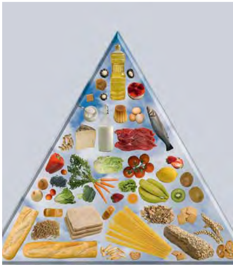
Es conveniente poner la pirámide nutricional en un sitio visible, por ejemplo en la nevera.

© Evitar el 'picoteo'. Evitar o, al menos, controlar el 'picoteo' ayuda a bajar de peso; los típicos snacks u otros productos hipercalóricos pueden sustituirse por zanahorias o frutas.