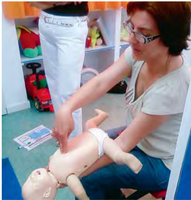
Imagen del taller realizado con padres y madres del CEIP La Naranja, de Beniján.

Se trata de aprender "técnicas muy sencillas de reanimación cardiopulmonar (RCP), desobstrucción de las vías aéreas (atragantamientos) y taponamiento de heridas", explica la secreta-